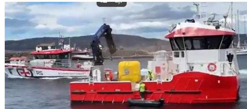
Alle foto Sandnessjøen Event : Anne Berit Tilrem